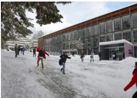
EC SPORT BRIG