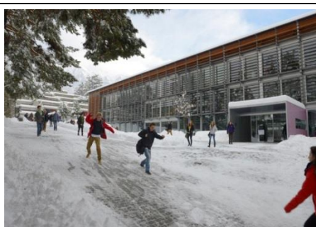
EC SPORT BRIG